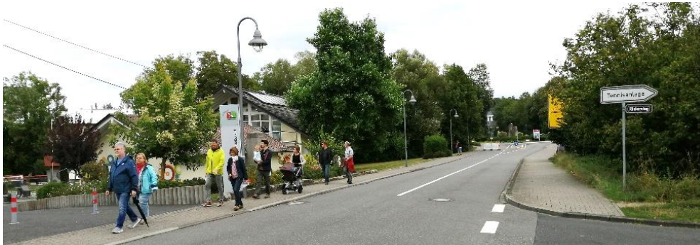
Arbeitsgruppe Mobilität beim Erkunden

Vor Ort sollten Ideen und Visionen entwickelt werden, die dann in den folgenden Arbeitskreissitzungen konkretisiert werden können. In den zwei Stunden der Erkundung konnten die Erkenntnisse nur exemplarisch an einigen Beispielen gewonnen werden.