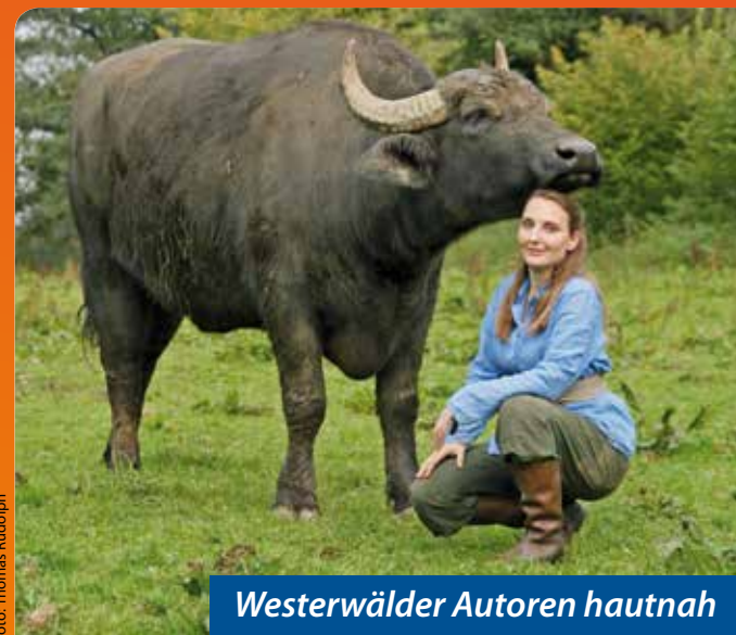
Westerwälder Autoren hautnah

Freitag, 24. Mai | 19.30 Uhr Stadthaus Selters